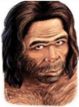
L'HOMME DE TAUTAVEI