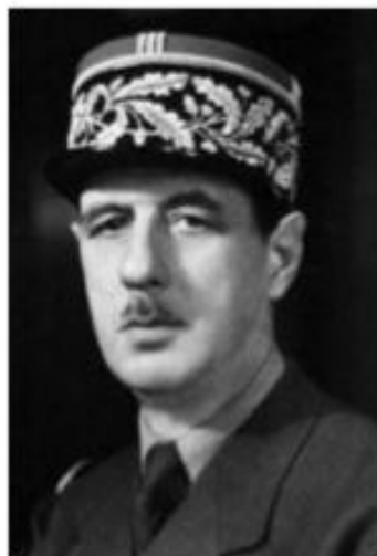
CHARLES DE GAULLE