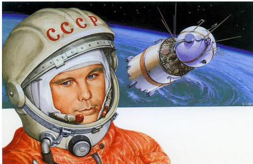
Youri Gagarine et sa capsule Vostok

C'est un événement mondial : ses premiers pas sur la Lune ont été retransmis en direct à la télévision