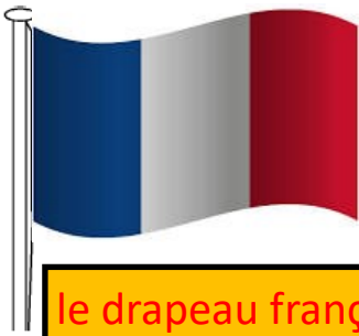
le drapeau français

Colorie le drapeau français. Ecris sous chaque image son nom : la Marseillaise, Marianne, le drapeau français, la devise . Colorie l'étiquette et entoure le passage du texte qui correspond de la même couleur.