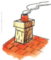
La cheminée fume.