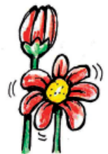
La fleur s'ouvre.