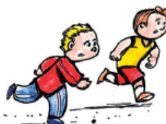
Les garçons courent.