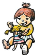
La fille joue.