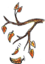
Les feuilles tombent.