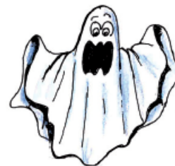
Le fantôme hurle.