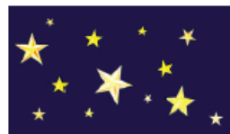
Les étoiles brillent.