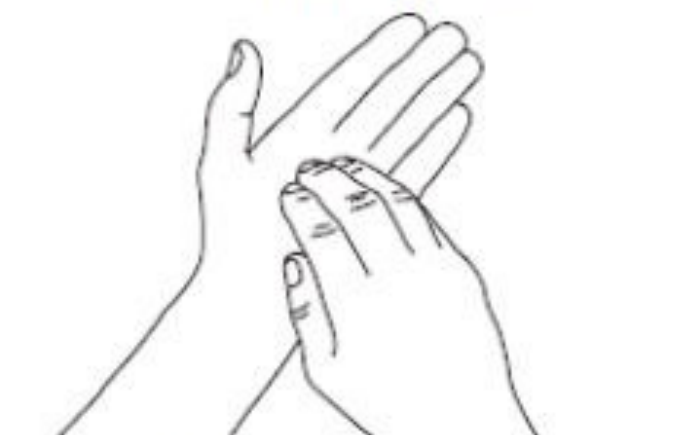
6 Ongles Désinfection des ongles