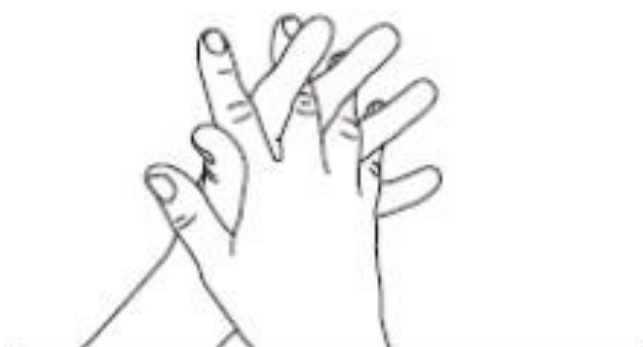
3 Doigts entrelacés Désinfection des espaces interdigitaux et des doigts