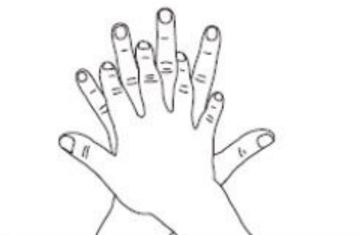
2 Paume sur dos Désinfection des doigts et des espaces interdigitaux