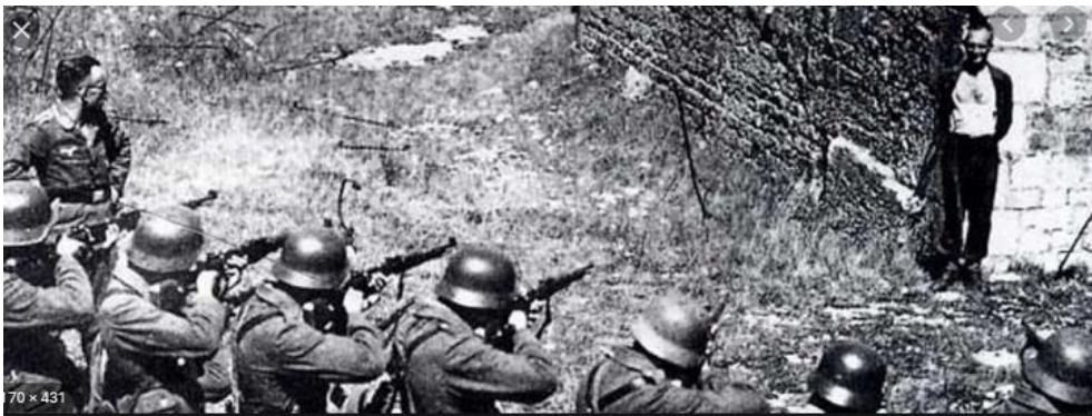
Ci-contre, un résistant français fusillé par un peloton allemand à Belfort en 1944

ci-dessous, les maquisards mettent au point leur action.