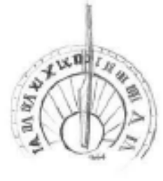
Un cadran solaire